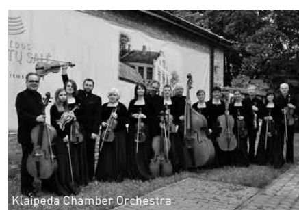
Klaipeda Chamber Orchestra

Sonntag, 11. Juni 2017 – Barockes Schlossfrühstück